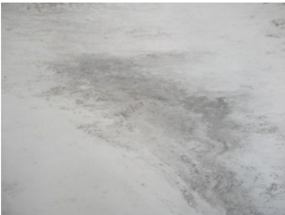
Flexibler Marmor Bahnen und Fliesen 2 mm stark – white marble