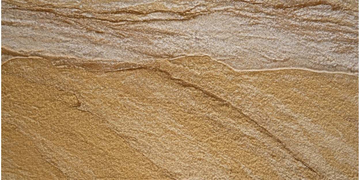
Flexibler Sandstein Yellow River